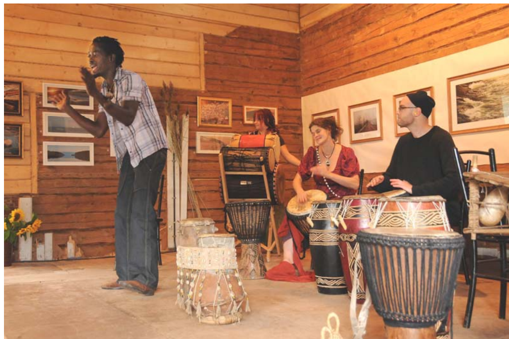
Exotiska afrikanska rytmer på Rigårdsnäs; The Vou Dou Land Band uppträder.